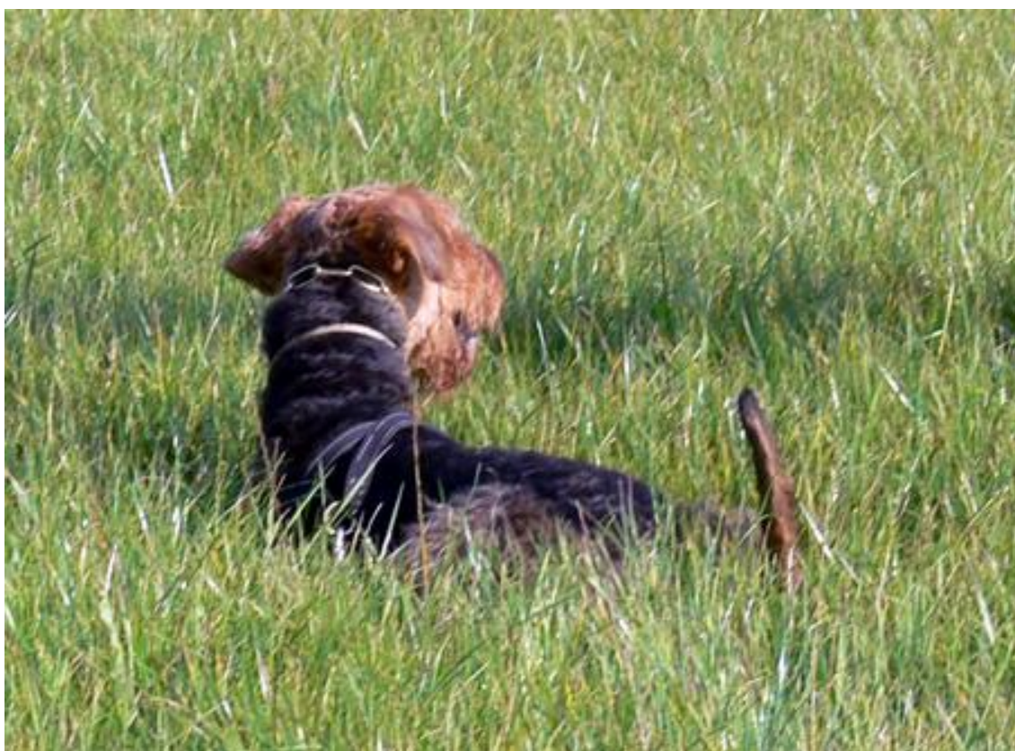
... und wie immer super-gerade am Gegenstand