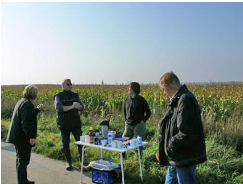
Frühstück unter blauem Himmel - herrlich!