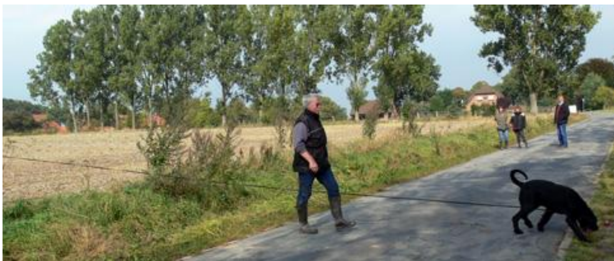
Strassenübergang mit - sehr leckeren - Äpfeln auf der anderen Strassenseite