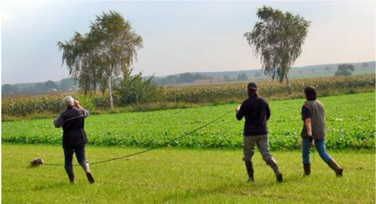
Erster Geländewechsel. Der Boden sieht besser aus, als er ist.