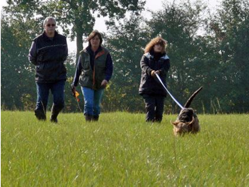
10 Meter Leine sind ganz schön lang - auch wenn das von vorne nicht so aussieht