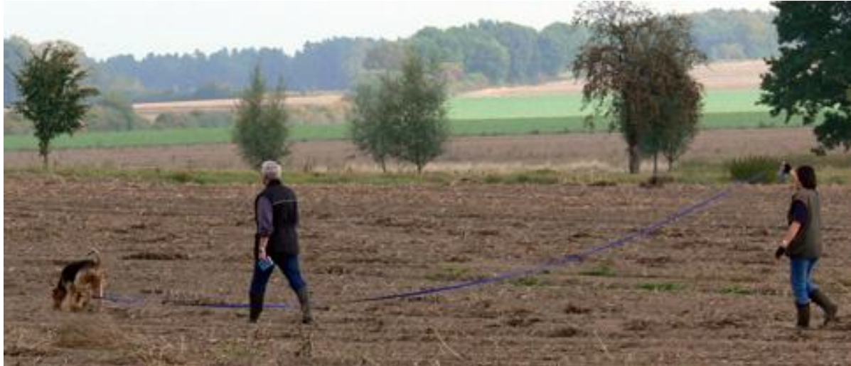
Und auf der anderen Seite dann harter schwarzer Acker