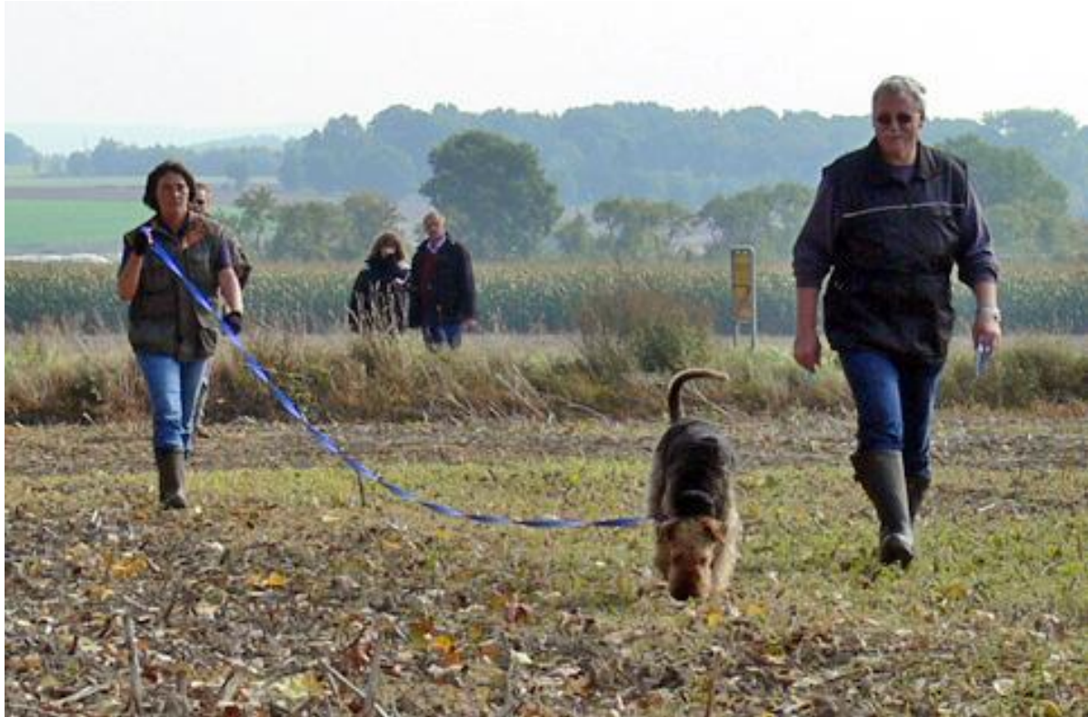
Aber Tai Tai sucht tapfer los