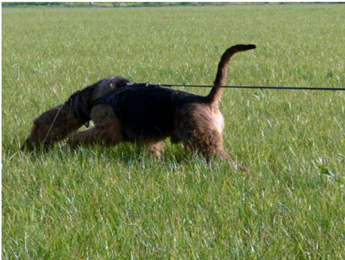
Ramses in seinem Element ....