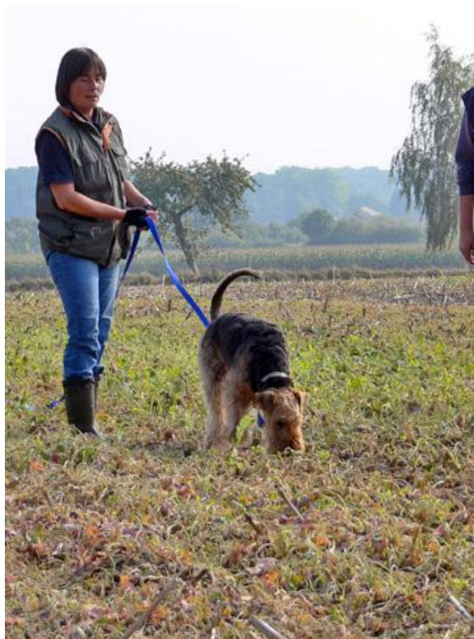
Was für ein Geläuf