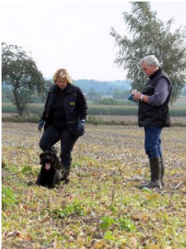
In all den Stoppeln einen Gegenstand Gefunden!