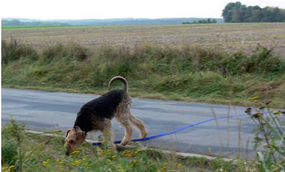
Null Problemo am Strassenübergang - Super, TaiTai!