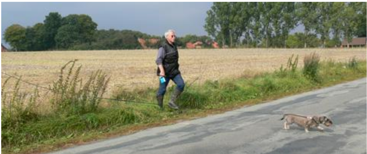
Ratz-Fatz über die Strasse. Frauchen ist noch nicht in Sicht