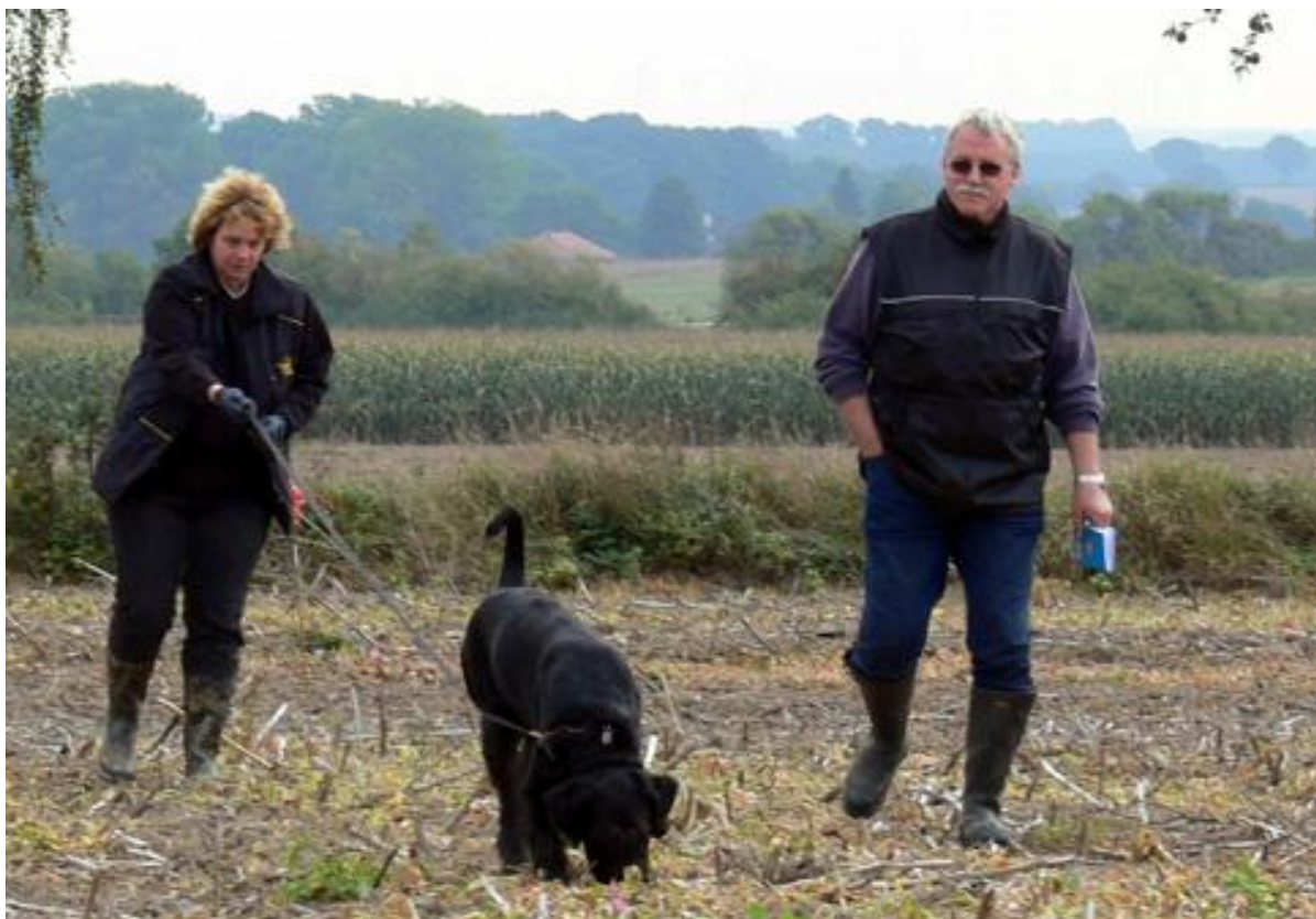
Endlich geht es für Gandhi auch los. Er konnte es kaum noch erwarten