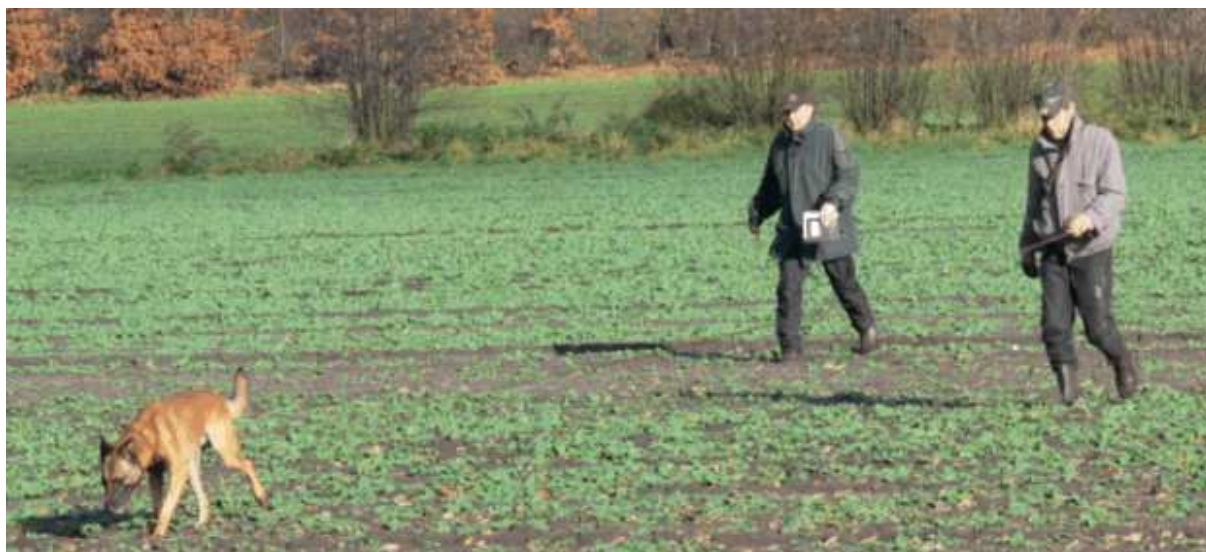
Athis kämpft sich durchs Gelände