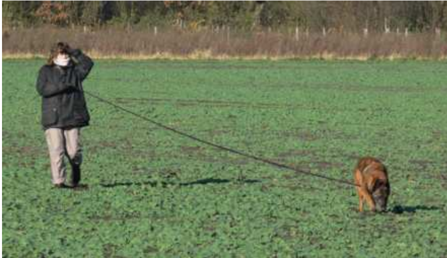
Da kam sogar die Sonne durch: Carmen wird geblendet